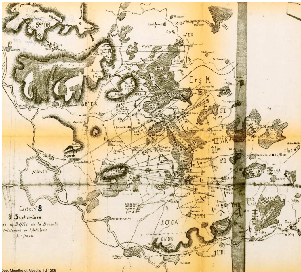
Dép. Meurthe-et-Moselle 1 J 1206

➤ Mets un point rouge à l'endroit des terribles combats d'Amance et de Champenoux.