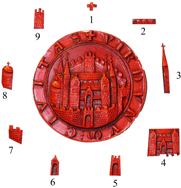
sceau de Verdun

➤ Identifie chaque n° à l'aide des mots suivants : chœur – nef – fenêtres en plein cintre – rempart – portail – croix chrétienne – porte fortifiée – tour à croix latine – tour crénelée