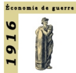
1916 Économie de guerre

🖱️ Cliquez sur la première partie « la guerre en 1916 » et la rubrique 1.3 « Guerre industrielle et armes de destruction massive » puis recherche les informations nécessaires pour compléter le cadre 1 de la carte mentale ci-dessous sur la mobilisation des économies des États en guerre.