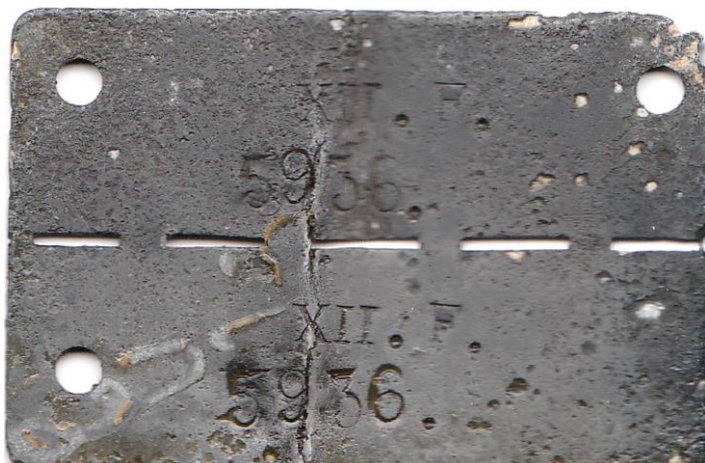
Image 2 : Plaque matricule N°5936 du stalag XIIF.