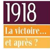
1918 La victoire... et après?

Compétences travaillées : ▶▶ Se repérer dans le temps : construire des repères historiques ▶▶ Analyser et comprendre un document.