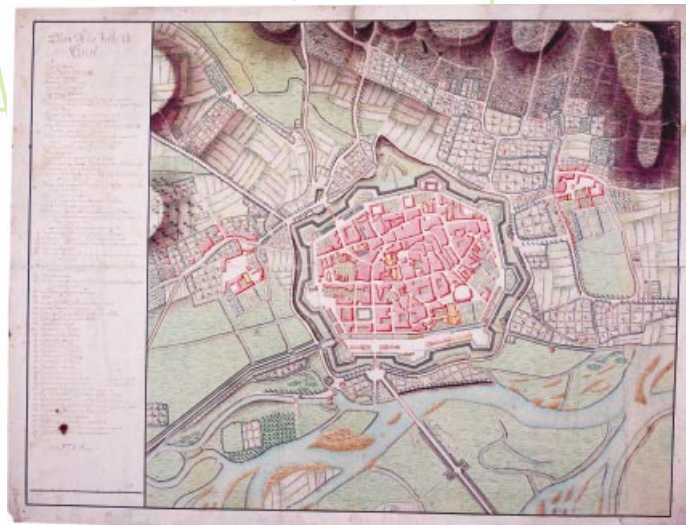
Plan de la ville de Toul. 1786. Papier, 64 x 83 cm.

Arch. dép. Meurthe-et-Moselle, 1 Fi 142.