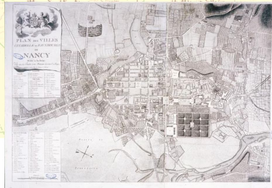
Plan des villes, citadelle et fauxbourgs de Nancy (...), par C. Mique. 1778. Papier, 86 x 116,5 cm.

Le plan de Mique montre la ville médiévale au découpage anarchique et la ville neuve, au plan en damier, les deux ensembles étant reliés par les travaux de Stanislas. Le tracé des fortifications marque la permanence d'une rupture entre la ville et ses faubourgs, malgré l'ouverture offerte par la pépinière royale. D'une qualité exceptionnelle, ce document illustre l'application à l'espace urbain des techniques modernes de levé et de représentation ; les édifices publics, représentés à l'échelle et en volume, se différencient nettement du bâti, représenté par îlots.