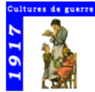
1917 - Cultures de guerre

Compétences travaillées : ► Analyser et comprendre un document. ► Raisonner, justifier une démarche et des choix.