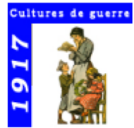
1917 - Cultures de guerre

Compétences travaillées : ▶▶ Se repérer dans le temps : construire des repères historiques ▶▶ Analyser et comprendre un document.