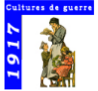
1917 - Cultures de guerre

🖱️ Cliquez sur la quatrième partie « l'information contrôlée pour répondre aux questions ci-dessous.