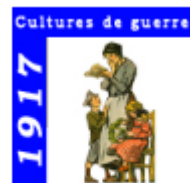
1917 - Cultures de guerre