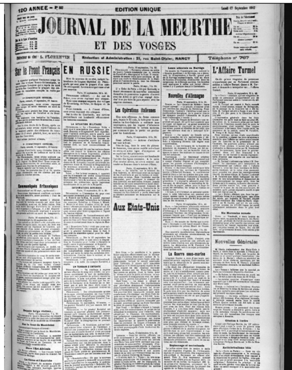
© Arch. Dép. Meurthe-et-Moselle PER 1122/106