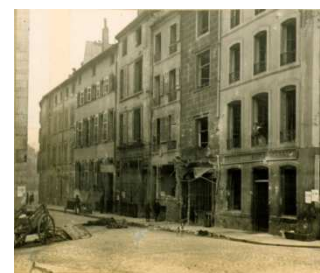
la Vieille-Ville (Grande-Rue)