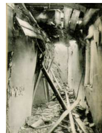
rue de la Source

➤ Dresse le rapport de l'événement en précisant la date, l'auteur du bombardement, les lieux de destruction et le nombre de victimes.