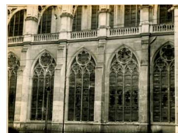
la basilique Saint-Epvre

Dans la nuit du 25 au 26 décembre 1914 un dirigeable allemand (zeppelin) a bombardé d'ouest en est la ville de Nancy en lançant 14 bombes. Parmi les sites touchés figurent la basilique St-Epvre, la Vieille-Ville et la Pépinière. On comptabilise 2 morts et 2 blessés.