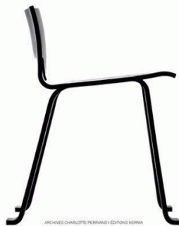
ARCHIVES CHARLOTTE PERRIAND / ÉDITIONS NORMA

CHARLOTTE PERRIAND L'ŒUVRE COMPLÈTE VOLUME 2 • 1940-1955 JACQUES BARSAC